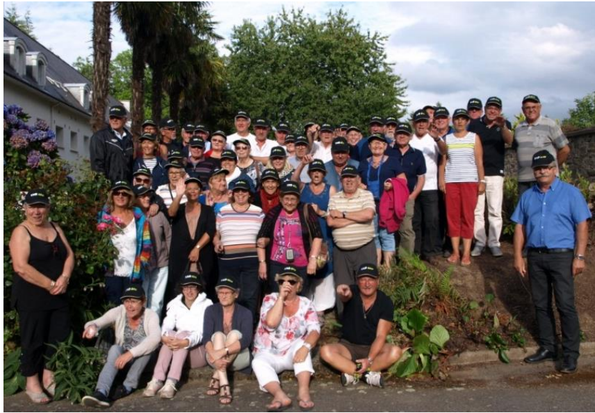
St Jeantais et amis de Plouedern devant le centre spirituel

Tôt le matin du 6 août, un groupe d'une quarantaine de personnes faisant partie de l'association la « Cité d'Echanges » a pris un bus pour effectuer un voyage en Bretagne afin de rendre visite à leurs amis de Plouedern.