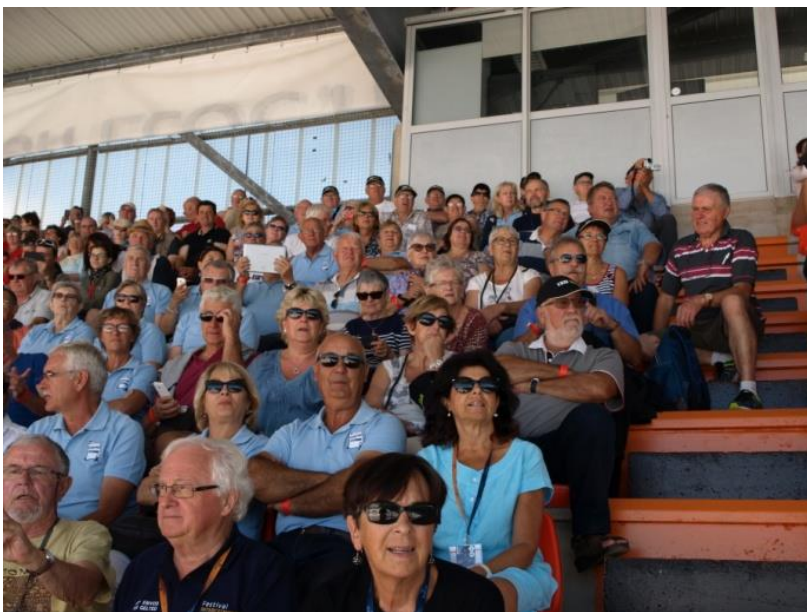
Dans la tribune officielle, St jeantais en polo bleu pour assister au FIL

Tôt le matin du 6 août, un groupe d'une quarantaine de personnes faisant partie de l'association la « Cité d'Echanges » a pris un bus pour effectuer un voyage en Bretagne afin de rendre visite à leurs amis de Plouedern.