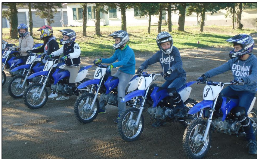
Quelques jeunes lors du séjour prévention moto