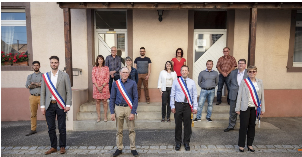
Le nouveau Conseil Municipal, après le vote