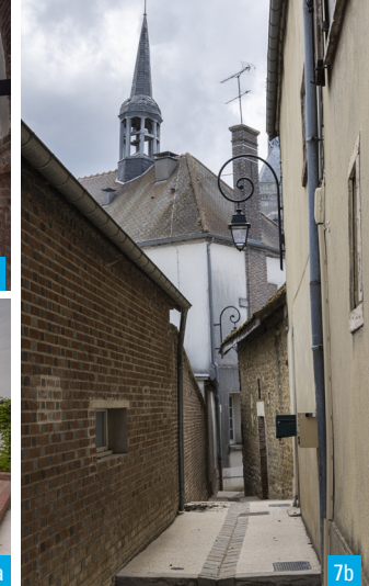
1. Vue entre la halle et la Maison du Vitrail d'Armançe / 7a. Les jardins des ateliers des métiers d'art / 7b. Au détour d'une ruelle

Récemment restaurée, elle est remarquable par sa statuaire et ses verrières aux motifs et allégories uniques en France, dont les célèbres Prédictions des Sibylles et les Triomphes de Pétrarque .