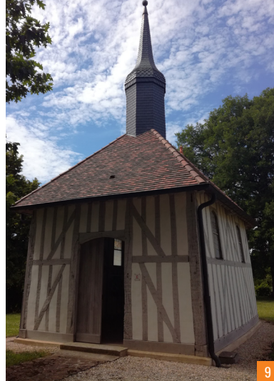
9. La chapelle Saint-Aubin / 10. Portrait d'Eugène Belgrand