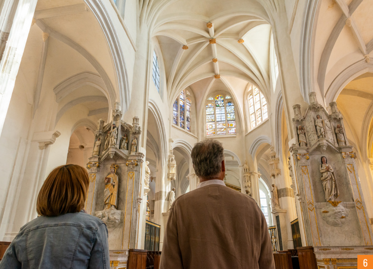
6. Vue du chœur de l'église Saint-Pierre-ès-Liens