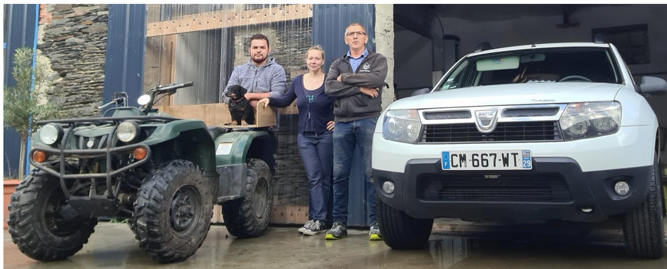
Photo collective 2022 des habitant.e.s de Locmelar ...

... Passez commande avant le 14 octobre !