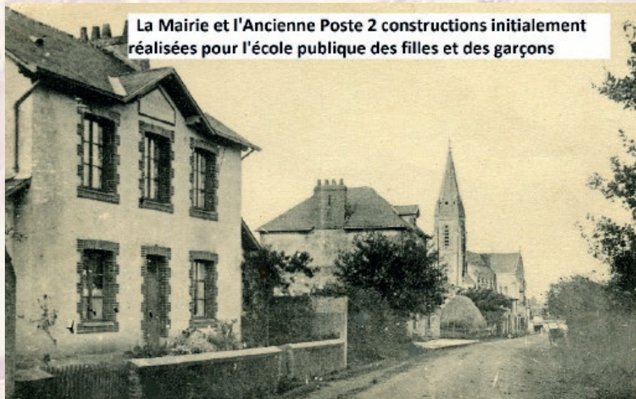
La Mairie et l'Ancienne Poste 2 constructions initialement réalisées pour l'école publique des filles et des garçons

Mais le but réel était surtout de former les futurs soldats de la revanche, avec l'abandon des langues régionales, l'apprentissage du français, du calcul, une certaine vision de l'Histoire de France. On habitua les élèves à l'idée d'une récupération de notre territoire perdu l'Alsace et la Lorraine. A la Remaudière, après de nombreux projets d'évolution d'écoles privées et publiques, deux maisons-écoles publiques