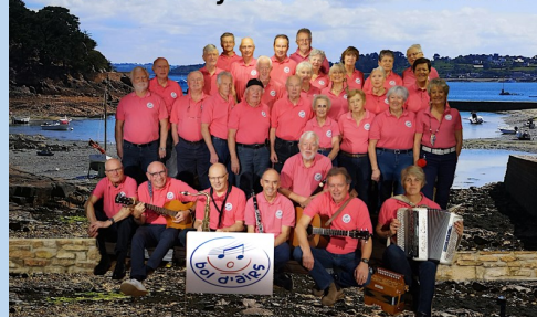
Salle Ti An Dourigou - Plonéis