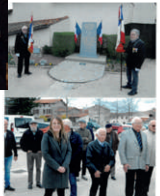
Commémoration 8 mai