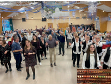
Repas des aînés 09/01/23