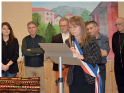
Cérémonie des vœux 2023