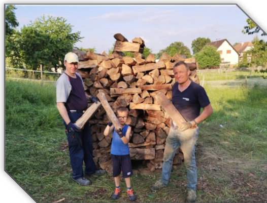
Dingbat : Boucle d'oreille