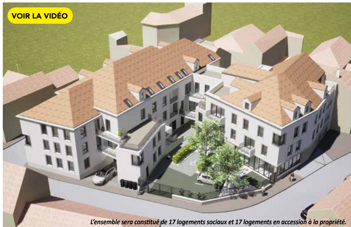
L'ensemble sera constitué de 17 logements sociaux et 17 logements en accession à la propriété.

Comme son nom l'indique, la Porte de Chartres est l'une des entrées du passé historique de la commune. Sa réhabilitation va lui donner accès à une nouvelle ère.