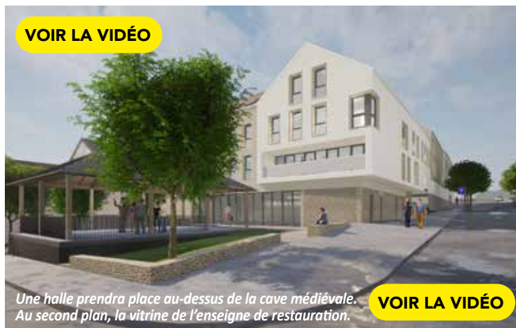
Une halle prendra place au-dessus de la cave médiévale. Au second plan, la vitrine de l'enseigne de restauration.