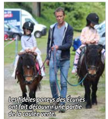
Les fidèles poneys des Écuries ont fait découvrir une partie de la coulée verte.