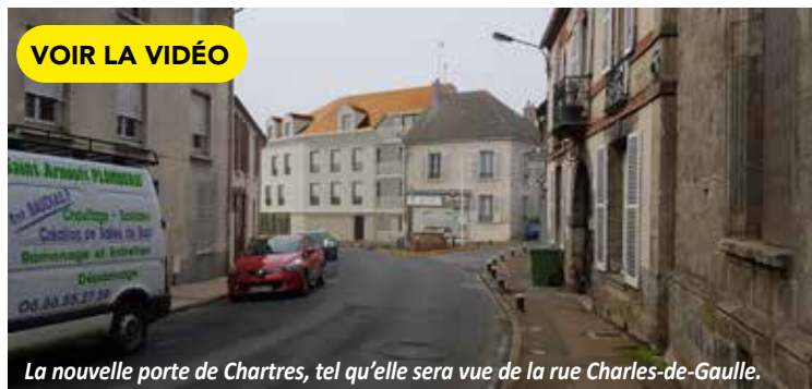
La nouvelle porte de Chartres, tel qu'elle sera vue de la rue Charles-de-Gaulle.

Sur l'opération de l'avenue Henri Grivot la municipalité a encaissé 640 000 € suite à une longue négociation ayant permis la revente de ses terrains à l'Établissement Public Foncier d'Île-de-France (EPFIF), qui ensuite a revendu l'intégralité