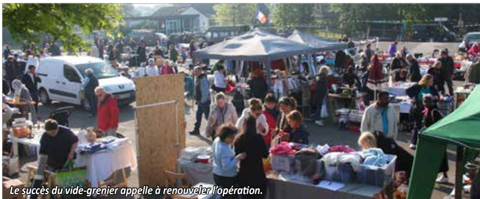
Le succès du vide-grenier appelle à renouveler l'opération.

Le prochain moment de partage collectif est programmé au mercredi 21 juin avec la Fête de la Musique. Une nouveauté est également au rendez-vous. Découvrez la en page 14.