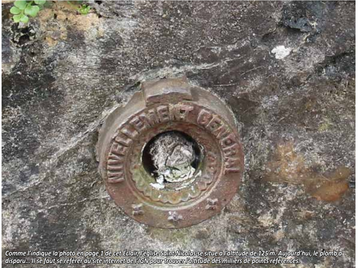
Comme l'indique la photo en page 1 de cet Éclair, l'église Saint-Nicolas se situe à l'altitude de 125 m. Aujourd'hui, le plomb a disparu... Il se faut se référer au site internet de l'IGN pour trouver l'altitude des milliers de points référencés.

Plusieurs définitions existent pour le terme Bourdalouë, dont une très sucrée. Mais celle qui nous intéresse ce mois-ci tire son origine de Paul Adrien Bourdalouë (1798-1868), conducteur des Ponts et Chaussées.