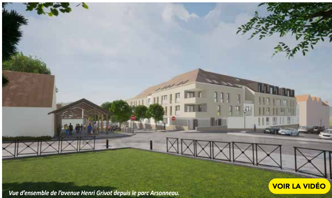
Vue d'ensemble de l'avenue Henri Grivot depuis le parc Arsonneau.

Scannez les QR Code avec votre appareil photo pour lire les vidéos. Elles sont également disponibles sur le site internet et la page Facebook de la commune.