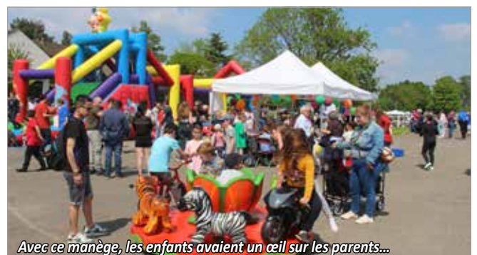
Avec ce manège, les enfants avaient un œil sur les parents...