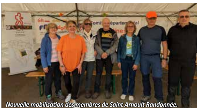
Nouvelle mobilisation des membres de Saint Arnoult Randonnée.