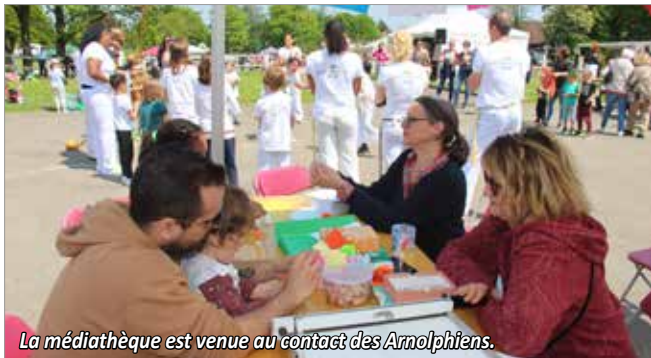
La médiathèque est venue au contact des Arnolphiens.