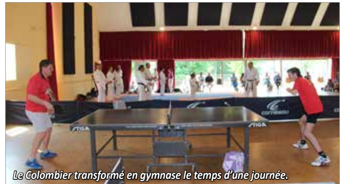
Le Colombier transformé en gymnase le temps d'une journée.