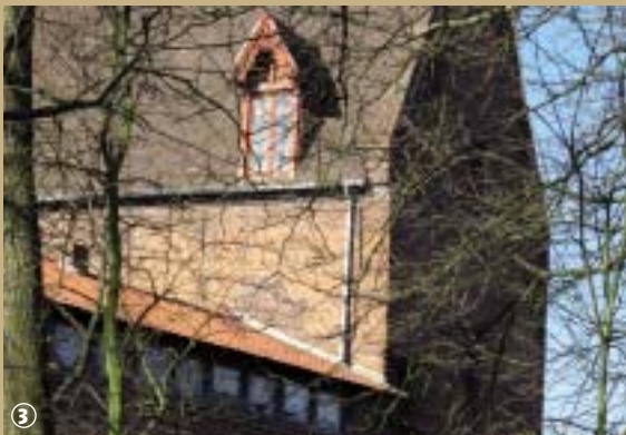
Ferme des Templiers

Petit village situé au nord-ouest de Lille, Verlinghem ne se trouve qu'à quelques kilomètres de la Belgique et de la vallée de la Deûle canalisée.