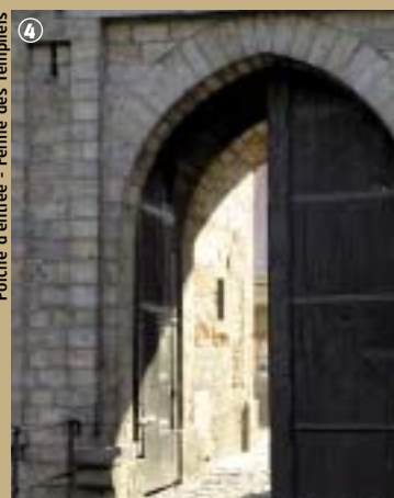
Porche d'entrée - Ferme des Templiers

Autrefois réputée pour sa distillerie de genièvre, la commune l'est encore pour sa foire aux fraises qui a lieu chaque année en juin. Mais si le temps des fraises est passé, ou pas encore venu, vous pouvez toutefois aller admirer les richesses architecturales du lieu ou prendre du bon temps à sa base de loisirs !