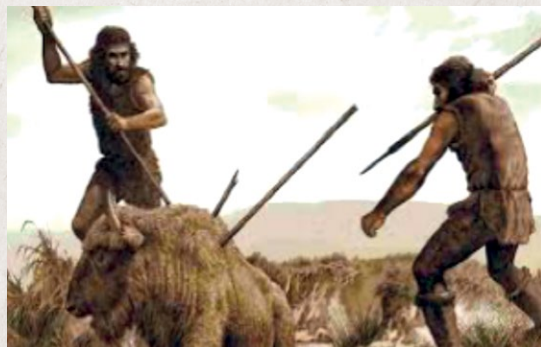
L'homme de Cro-Magnon à la chasse dans la région, près d'un vieux pont...

Notez ces dates sur vos agendas dès maintenant.