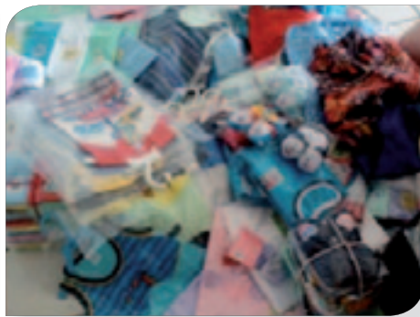
Vêtements pour les enfants de l'orphelinat.