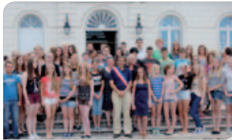
Réception des jeunes à la mairie de Bléré – Août 2014.

Du 24 au 28 Juillet 2015, une délégation allemande sera présente au vide-grenier organisé par l'Union Commerciale de Bléré. Ils proposeront leurs pro-