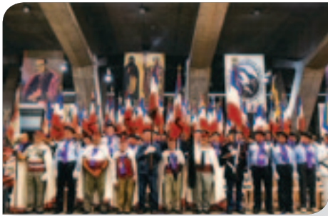
La Grande messe à la Basilique souterraine.