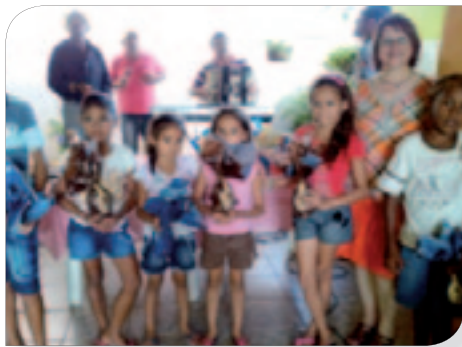
Distribution des œufs de Pâques.