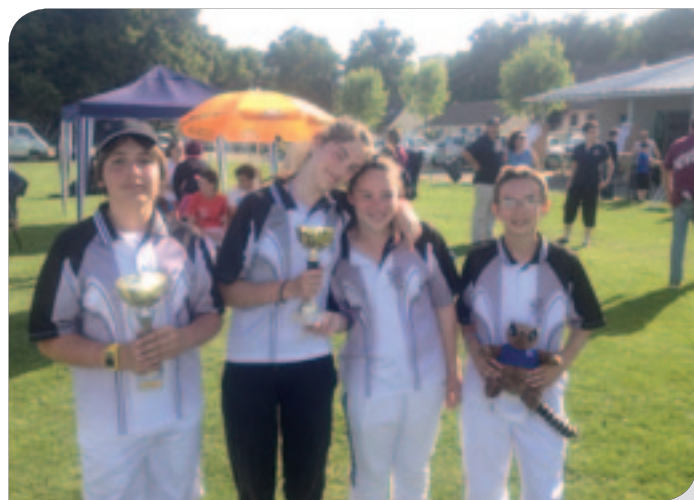
L'équipe des jeunes championne de ligue.

et surtout, dix sélections aux championnats de France et un champion de France.