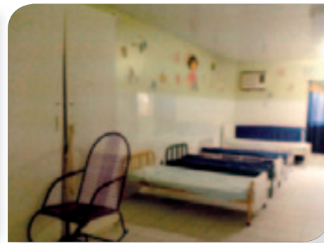
L'orphelinat de Belem.