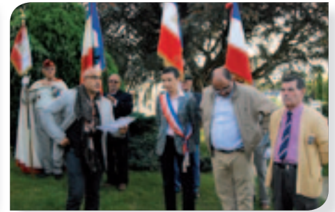
Stèle des Harkis Château-Renault.

P etite rétrospective de nos activités dans notre département et à l'extérieur :