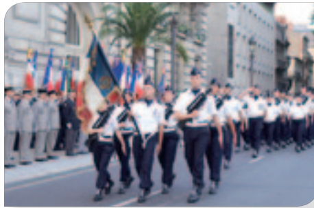
Défilé place de l'Hôtel de Ville à Tours.