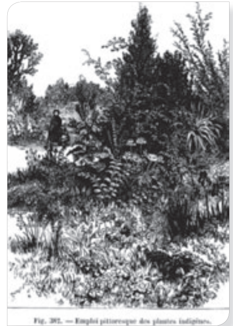
Fig. 302. — English potpourri of plants indigenous.

Année très studieuse où nous avons travaillé sur les liens d'Edouard André avec le Royaume-Uni, ainsi que sur son amitié professionnelle avec un autre théoricien des jardins, William Robinson, qu'il cite longuement dans son ouvrage L'art des Jardins . Un essai retraçant ces liens précède la traduction de l'ouvrage de celui-ci qui vient d'être publiée Le Jardin Sauvage ou Jardin Naturel, le fameux Wild Garden de William Robinson. Notre présence aux Journées de printemps de Courson nous a permis de présenter une exposition retraçant ces liens et échanges entre ces deux pays dans le domaine des jardins à la fin du XIX e siècle, exposition qui a été également présentée à la Fête du Parc à La Croix-en-Touraine en septembre, en même temps que l'ouvrage cité ci-dessus.