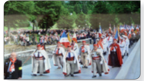
Les Spahis au Pèlerinage

En 2016, LOURDES nous accueillait à l'occasion du pèlerinage des anciens combattants d'Algérie. Toujours fidèles à notre engagement, nous étions hébergés à la pension familiale du Nord-Pas de Calais où nous avons fait le point sur notre dernière rencontre de 2015 au Futuroscope de Poitiers. Les effectifs diminuent et bien sûr, il ne peut y avoir de relève. Il faut donc les uns et les autres faire de plus en plus d'efforts, et cela n'est pas évident ; le bureau existe toujours mais avec un effectif bien réduit (la présidence en Touraine, le secrétariat en Deux-Sèvres, la comptabilité en Vendée, une réunion de bureau environ tous les deux mois). A Lourdes, les travaux de notre amicale ont été effectués en un seul jour, car nous avons cinq grosses journées à accomplir ensuite. En effet, notre groupe a été retenu pour assurer la garde d'honneur de ce pèlerinage à toutes les grandes cérémonies du matin et du soir, ainsi que les chemins de croix de la Vierge Marie et autres.