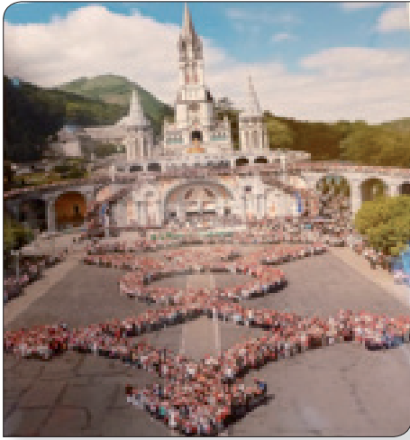
Croix du Sud composée de pèlerins

Notre amicale a vu le Jour en 1998 à la Croix en Touraine, où nous nous étions rassemblés trois jours au Château de la Herserie. Nous y avons retrouvé le colonel d'AVOUT d'AUERSTAEDT devenu Général, qui à cette époque commandait le régiment 2ème de Spahis en zone Interdite en Algérie. Le but de cette 1ère rencontre était de rassembler des témoignages précis sur nos trois camarades du peloton de traque à l'état Major, tués au combat sur la période d'Avril 1956 à Décembre 1957. Soixante dix spahis étaient présents pour cette rencontre soit une trentaine de départements. A la suite de cette rencontre, est née notre amicale,