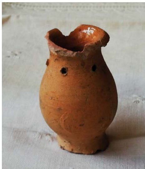
Petite poterie retrouvée dans les anciennes serres de la villa Colombia, qui servait à la multiplication du mimosa.

Cette année a été l'occasion de découvrir la propriété d'Edouard André dans le Midi de la France, alors que nous la croyions disparue et lotie.