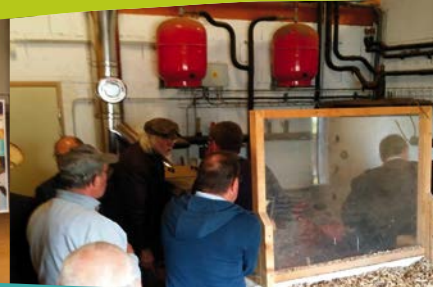
Circuit de visites « Energies renouvelables » : géothermie et chaufferies bois