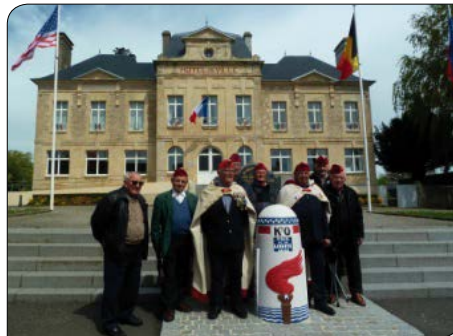
Hôtel de Ville Ste Mer-Eglise Km - 0