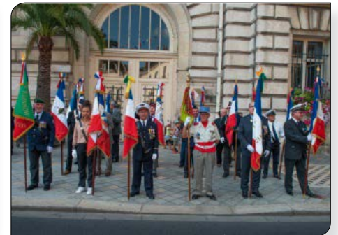
14 Juillet TOURS

L'année 2019 a été très calme en raison de l'âge des adhérents de l'amicale.