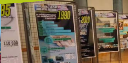
Expo-conférence à Villedômer « La place des écrans dans notre quotidien »