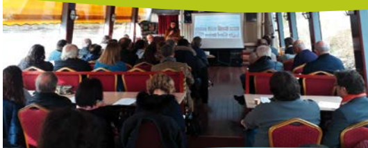
Lancement du projet de coopération Leader autour de la Vallée du Cher.