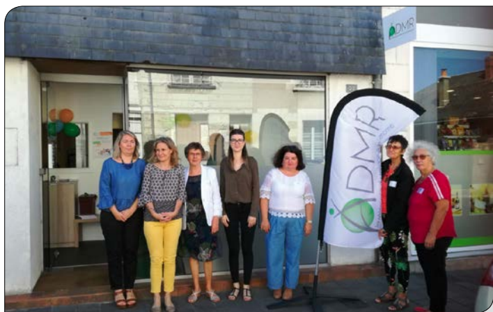
Les bénévoles et salariées responsables de l'Association lors de l'inauguration des locaux à BLÉRÉ