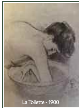
La Toilette - 1900