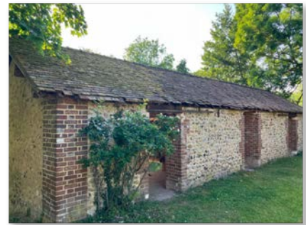
lavoir de Cocherel