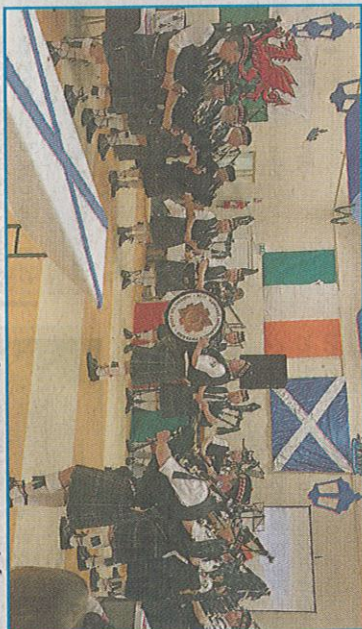
140 convives et 23 musiciens présents pour cette soirée.