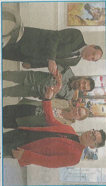
Le vernissage de l'exposition a eu lieu ce samedi 30 mars.