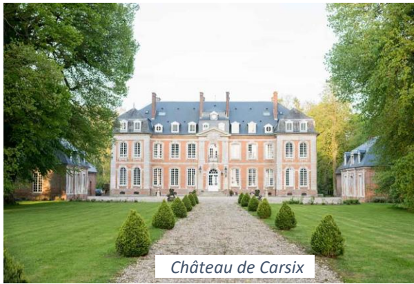
Château de Carsix