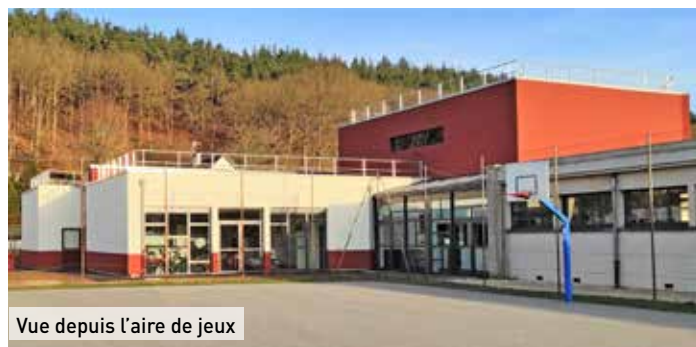
Vue depuis l'aire de jeux

Depuis les vacances de février, une des nouvelles salles de classe, récemment achevée, est occupée par les élèves d'une classe élémentaire. À proximité sont également achevés une salle de classe maternelle, un dortoir, des toilettes, une salle informatique et bibliothèque, une salle de jeux, le bureau de la direction scolaire et des locaux de service.