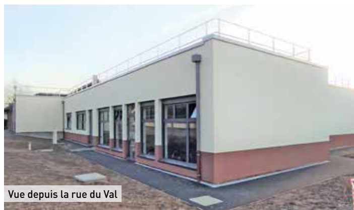
Vue depuis la rue du Val

Les clôtures et les accès seront implantés pour répondre à ces conditions. Trois portails équipés d'interphones, reliés à la direction de l'établissement, donneront accès au site depuis la rue du Val et la rue Jules Ferry pour desservir les classes maternelles, et la rue Jules Ferry pour les classes élémentaires.