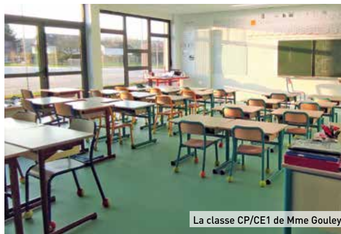
La classe CP/CE1 de Mme Gouley

Depuis les vacances de février, une des nouvelles salles de classe, récemment achevée, est occupée par les élèves d'une classe élémentaire. À proximité sont également achevés une salle de classe maternelle, un dortoir, des toilettes, une salle informatique et bibliothèque, une salle de jeux, le bureau de la direction scolaire et des locaux de service.