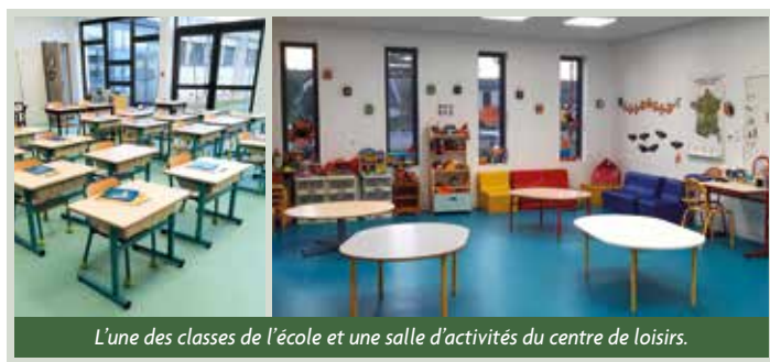
L'une des classes de l'école et une salle d'activités du centre de loisirs.

taire, le groupe scolaire a accueilli 147 élèves, des classes maternelles et élémentaires, à la rentrée de septembre 2022.