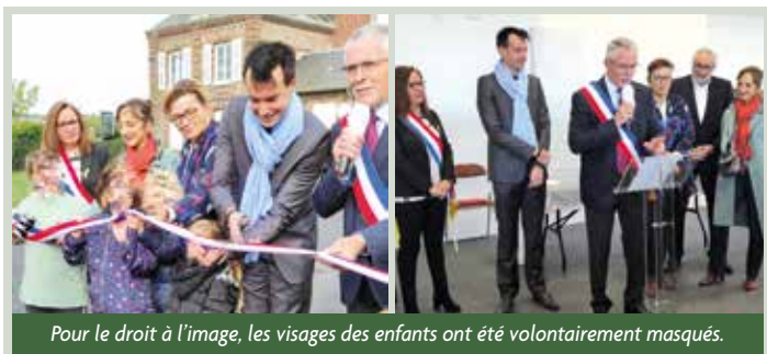
Pour le droit à l'image, les visages des enfants ont été volontairement masqués.