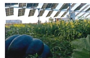
Partenariat avec INRAE