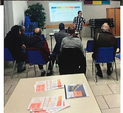
Réunions publiques, permanences et ateliers