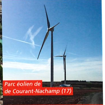
Parc éolien de Courant-Nachamp (17)