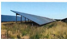
Reprise de la Molinie bleue . Site de Gabardan (40)

Intégration optimale des installations au cœur de la faune et la flore locales.