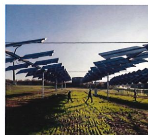
Renardières, trois années de retour d'expérience : Fourrage, maraîchage, blé.