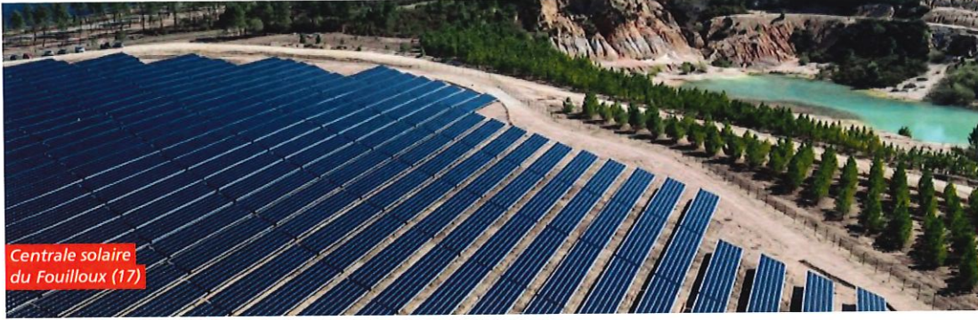
Centrale solaire du Fouilloux (17)