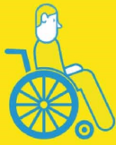
PERSONNES HANDICAPÉES OU MALADES À DOMICILE