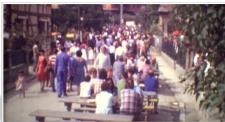
Une des premières fêtes des rues.

C'est dans le cadre de cette association et avec la participation de toutes les associations du village et des habitants que les 1eres fêtes des rues ont été créées pour financer les travaux de la salle polyvalente. Fêtes des rues qui ont eu un succès mémorable puisque que l'on en parle encore aujourd'hui.