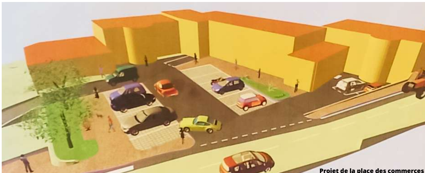
Projet de la place des commerces