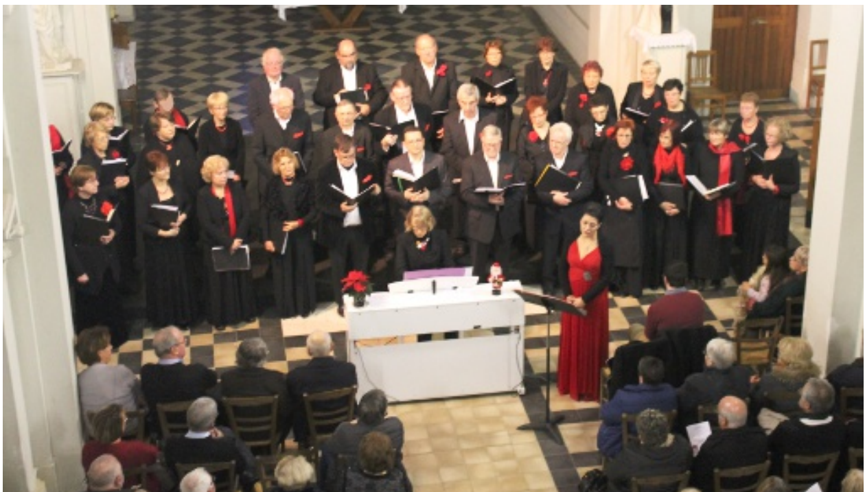
Concert de « Musique en Chœur » du 18 décembre 2016

Le bulletin municipal paraît régulièrement. (suite page 2)