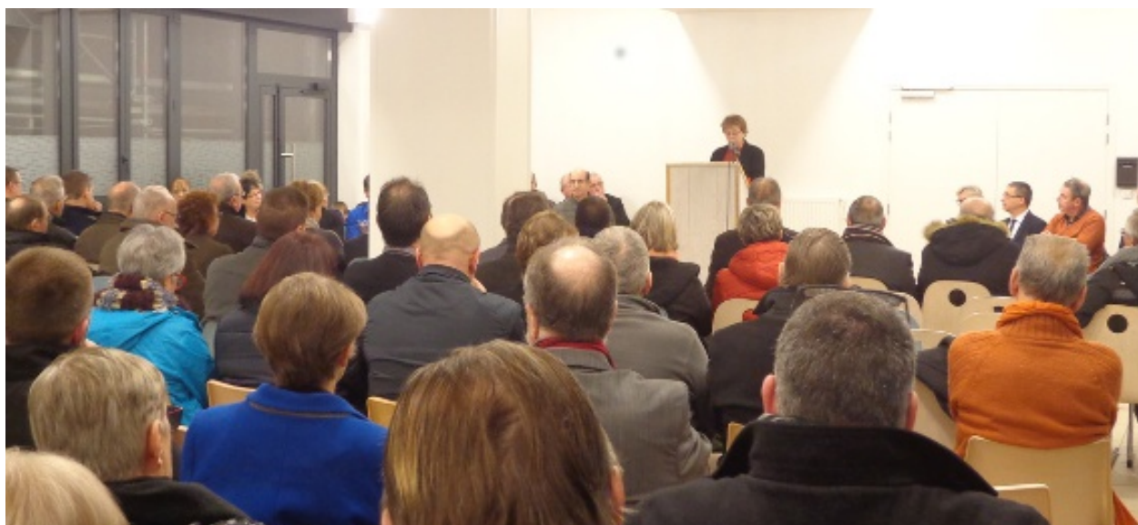
Cérémonie des vœux du 23 janvier 2019, en présence de Nicolas Fricoteaux, président du Conseil Départemental de l'Aisne.