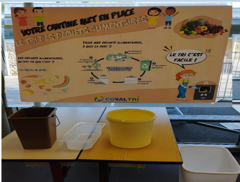
Les enfants participent au « tri sélectif » à la cantine.