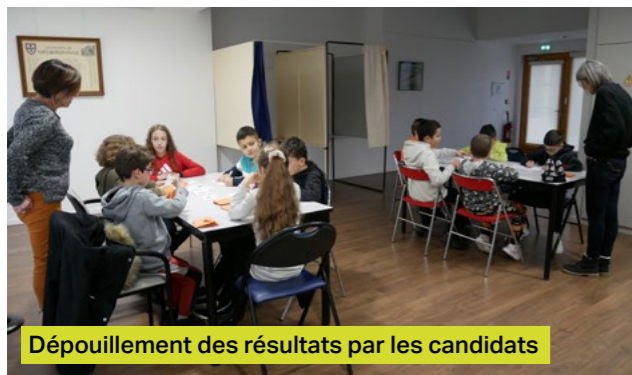
Dépouillement des résultats par les candidats