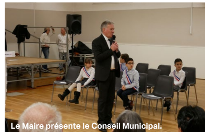
Le Maire présente le Conseil Municipal.

VENDREDI 6 JANVIER : PREMIERS VOEUX DU MAIRE AUX ROMANÈRES