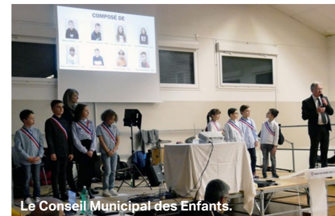
Le Conseil Municipal des Enfants.