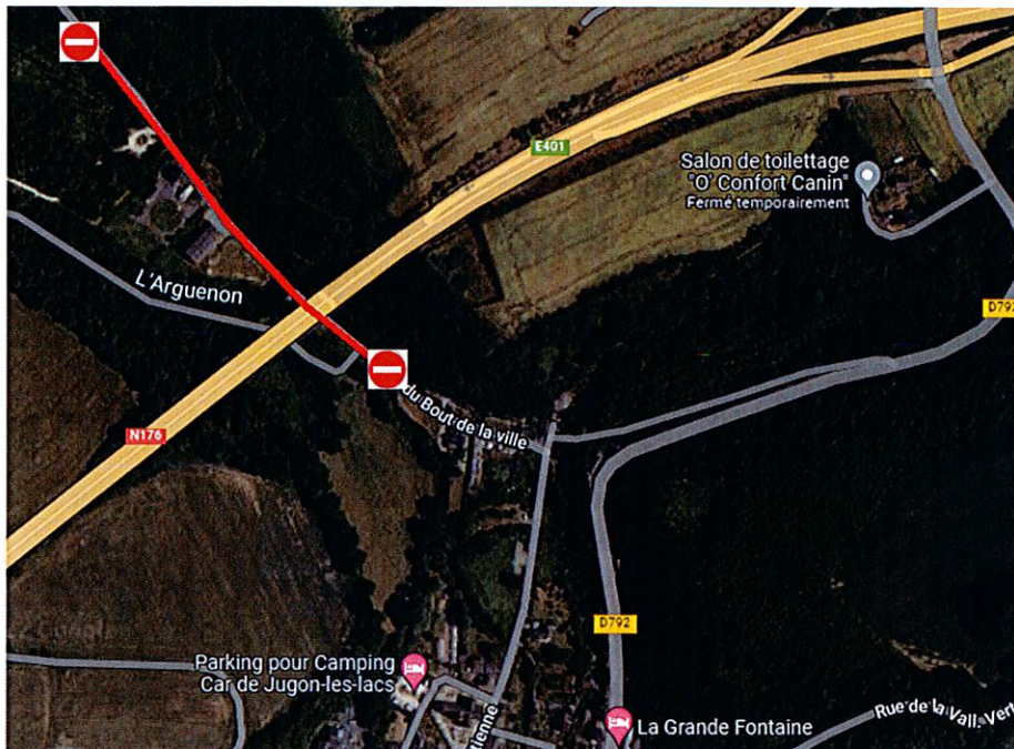
Ligne rouge : interdiction de circulation VC 25