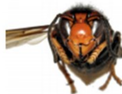
Frelon asiatique à pattes jaunes, Vespa velutina

Son thorax et ses pattes sont noirs et brun-rouges. Les ouvrières mesurent entre 18 et 23mm et les reines entre 25 et 35mm.