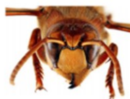
Frelon d'Europe, Vespa crabro