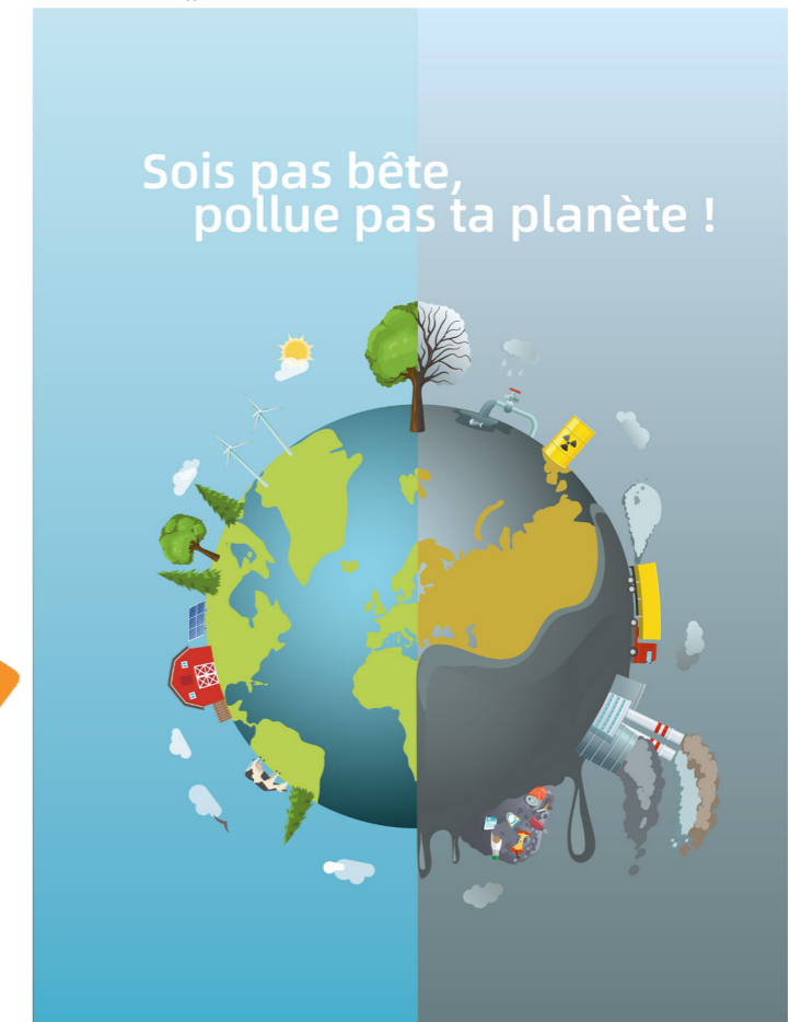
Le visuel de l'affiche