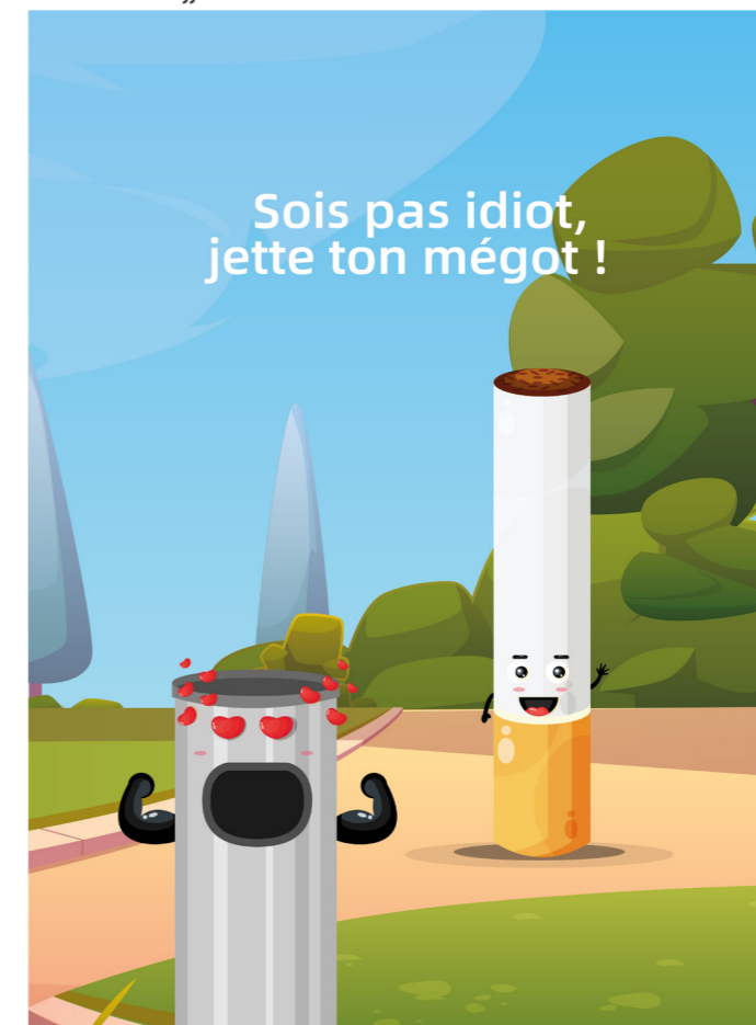
Le visuel de l'affiche