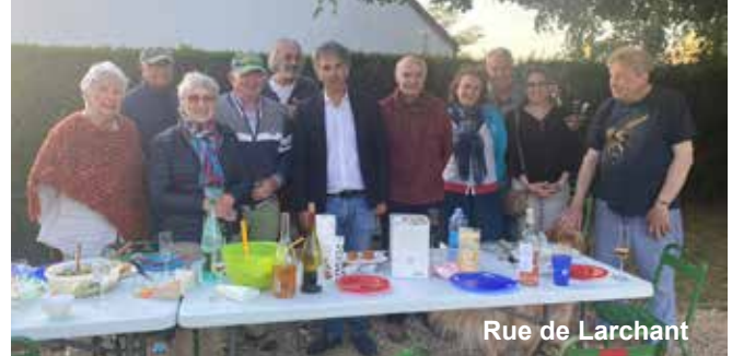
Rue de Larchant