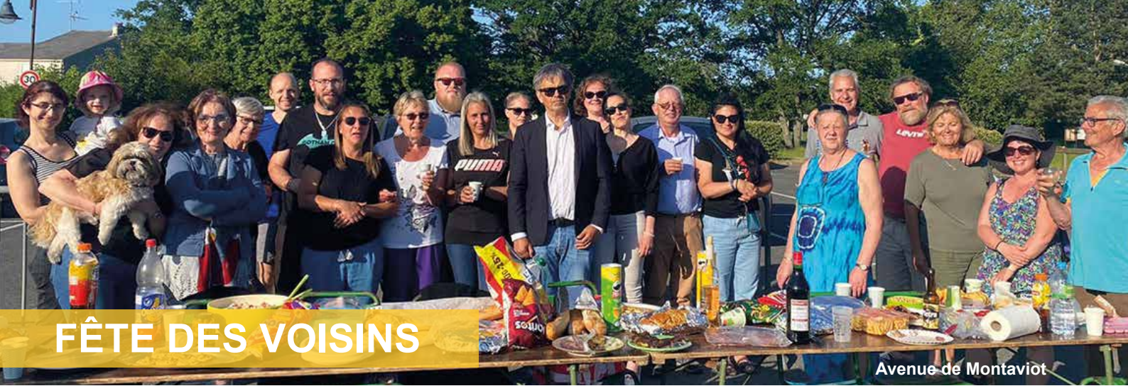
Avenue de Montaviot

Vendredi 2 juin, Saint-Pierre-lès-Nemours renouait avec la traditionnelle fête des voisins. La cohésion sociale est nécessaire et cette 24 e édition a été l'occasion de se retrouver et de recréer un esprit de partage et d'échange. L'événement particulièrement important pour la ville a permis de maintenir le formidable élan de solidarité et de générosité des habitants, de recréer du lien par le biais des rencontres entre les habitants. Chacun était heureux de se retrouver et de profiter d'une soirée chaleureuse à l'avant-goût d'été.