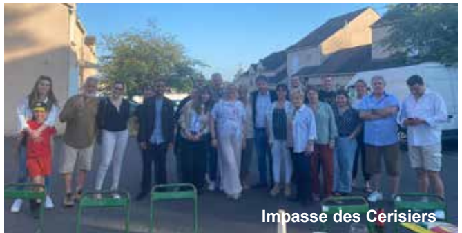
Impasse des Cerisiers