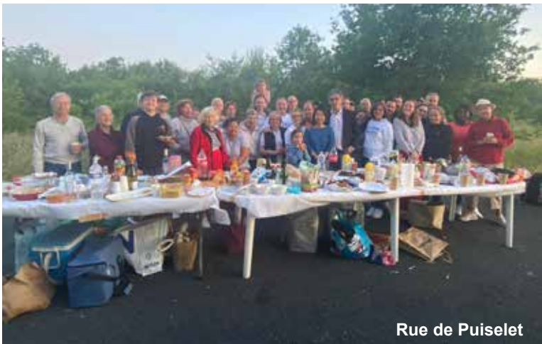
Rue de Puiset