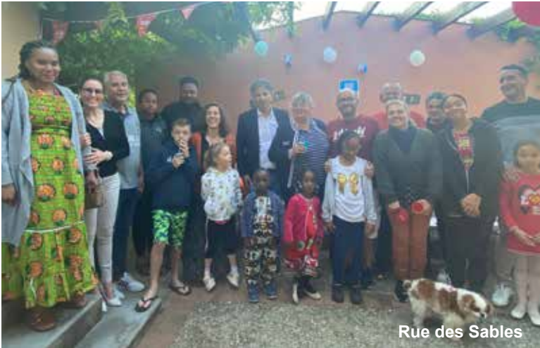
Rue des Sables

Vendredi 2 juin, Saint-Pierre-lès-Nemours renouait avec la traditionnelle fête des voisins. La cohésion sociale est nécessaire et cette 24 e édition a été l'occasion de se retrouver et de recréer un esprit de partage et d'échange. L'événement particulièrement important pour la ville a permis de maintenir le formidable élan de solidarité et de générosité des habitants, de recréer du lien par le biais des rencontres entre les habitants. Chacun était heureux de se retrouver et de profiter d'une soirée chaleureuse à l'avant-goût d'été.