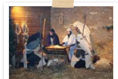
Crèche vivante et marché de Noël