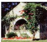
Les Amis de la Nature et des Fleurs