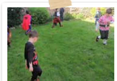
Chasse aux œufs