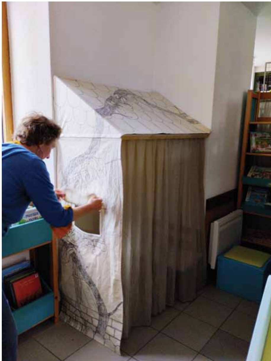
Petit nid douillet

Un grave accident de la route va mettre fin à ce rêve. Elle est grièvement blessée et devient presque aveugle.