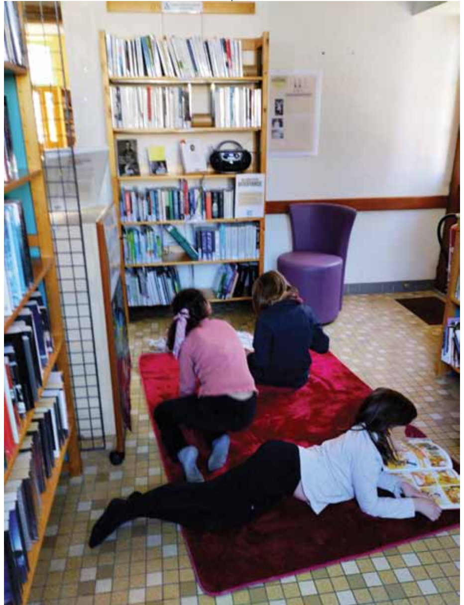
Se poser et lire

S'isolant suite à un drame pour disparaître de soi-même, l'héroïne, happée par le jardin de sa nouvelle location