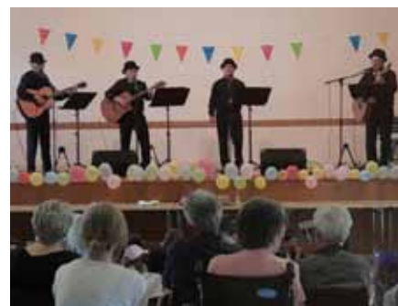
Les Melon Noirs