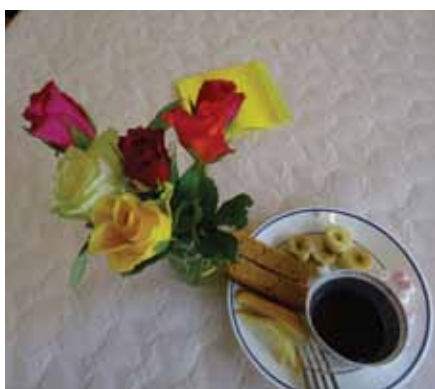
Fondue au chocolat