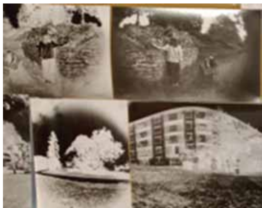
Photos réalisées par des jeunes à l'atelier photographique, Rennes

rière, que l'on peut capturer sur un support photosensible, tel que du papier photographique. Comme l'œil, le sténopé capture des images inversées du visible.