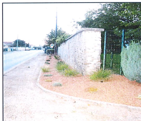
Réalisation d'un parterre paysager rue Eugène Dorlet