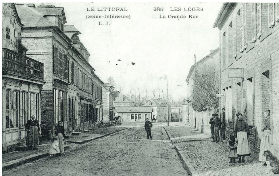
LE LITTORAL (Seine-Inférieure) L. J.