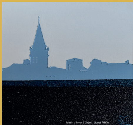
Matin d'hiver à Orcet