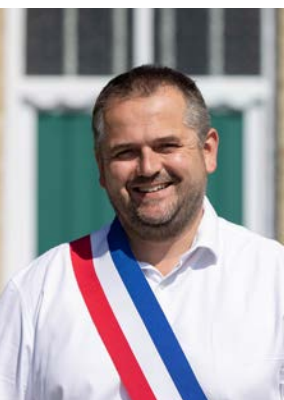
Sébastien Lescieux Maire de Bierne