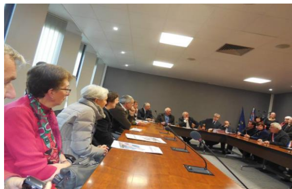
Manifestation à l'inauguration de la Maison de Retraite de Vermenton et au Conseil Régional de Bourgogne à Dijon