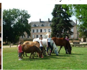
Sortie de fin d'année au Poney Club d'Epineau-les Voves en Juin 2015