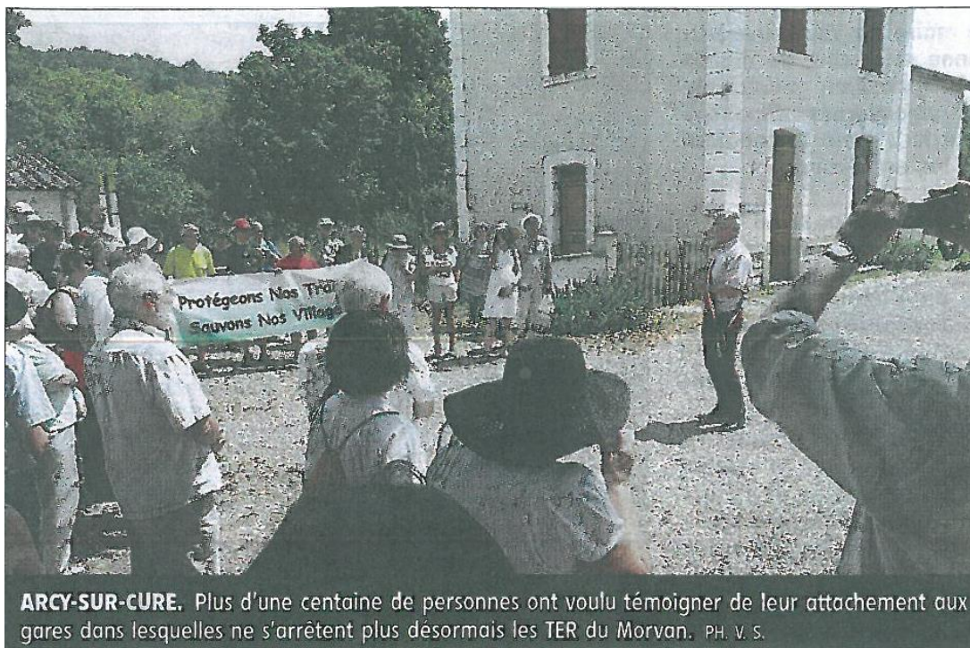
ARCY-SUR-CURE. Plus d'une centaine de personnes ont voulu témoigner de leur attachement aux gares dans lesquelles ne s'arrêtent plus désormais les TER du Morvan.