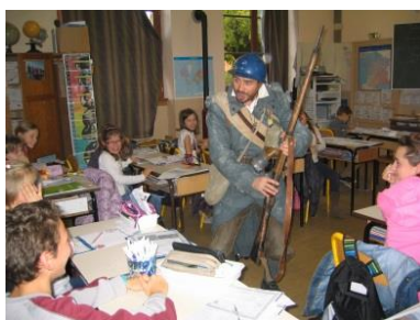
Comédien intervenant en classe pour les commémorations du 11 Novembre 1914