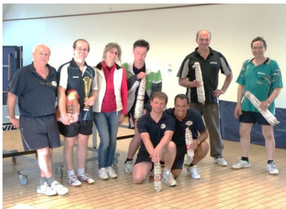
Nos gagnants du tournoi 2016 !

N'hésitez pas à contacter les membres de l'association pour plus de renseignements.