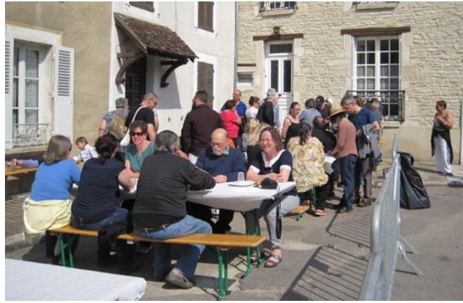
Pain Beurré dans la Place Pasteur 8 mai 2016

L'an passé commençait avec un certain optimisme mais une série de facteurs compliqués a engendré une certaine perte d'élan dans nos activités pour 2016. Au cours de 2015, des membres clés du bureau ont malheureusement démissionné principalement pour des raisons professionnelles et autres ce qui nous a freinés cette année.