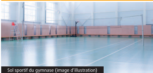
Sol sportif du gymnase (image d'illustration)