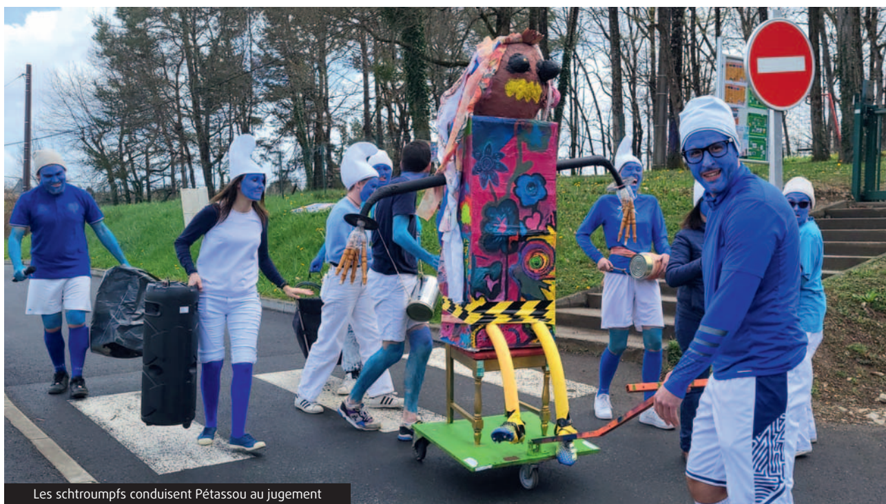
Les schtroumpfs conduisent Pétassou au jugement

Pendant plusieurs semaines, encadrés par les animateurs de l'accueil de loisirs, les enfants de l'école se sont adonnés à préparer le Carnaval et ont confectionné le célèbre Pétassou. Sur la pause méridienne, retentissaient des musiques rythmées annonçant la présentation de quelques danses, préparées avec les animateurs, en l'honneur de ce prochain jour de fête.