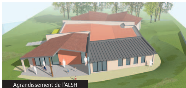
Agrandissement de l'ALSH