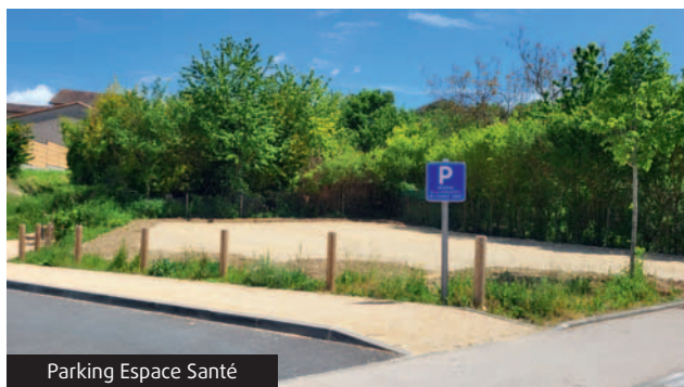
Parking Espace Santé

À l'arrière de l'Espace Santé, un parking en castine a été conçu pour créer quelques places de stationnement supplémentaires non matérialisées.