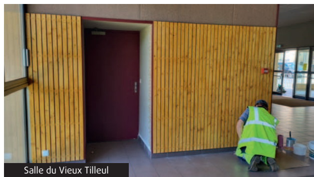
Salle du Vieux Tilleul

A la mairie, les luminaires vétustes énergivores ont été remplacés par des LED plus économes.