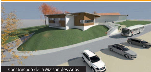
Construction de la Maison des Ados