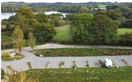
Aire naturelle et emplacements