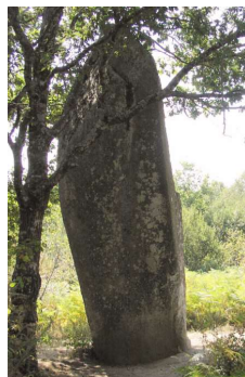
Menhir de Cinturat