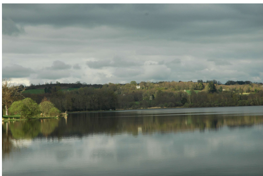
L'Etang privé de Cieix dédié à la pêche