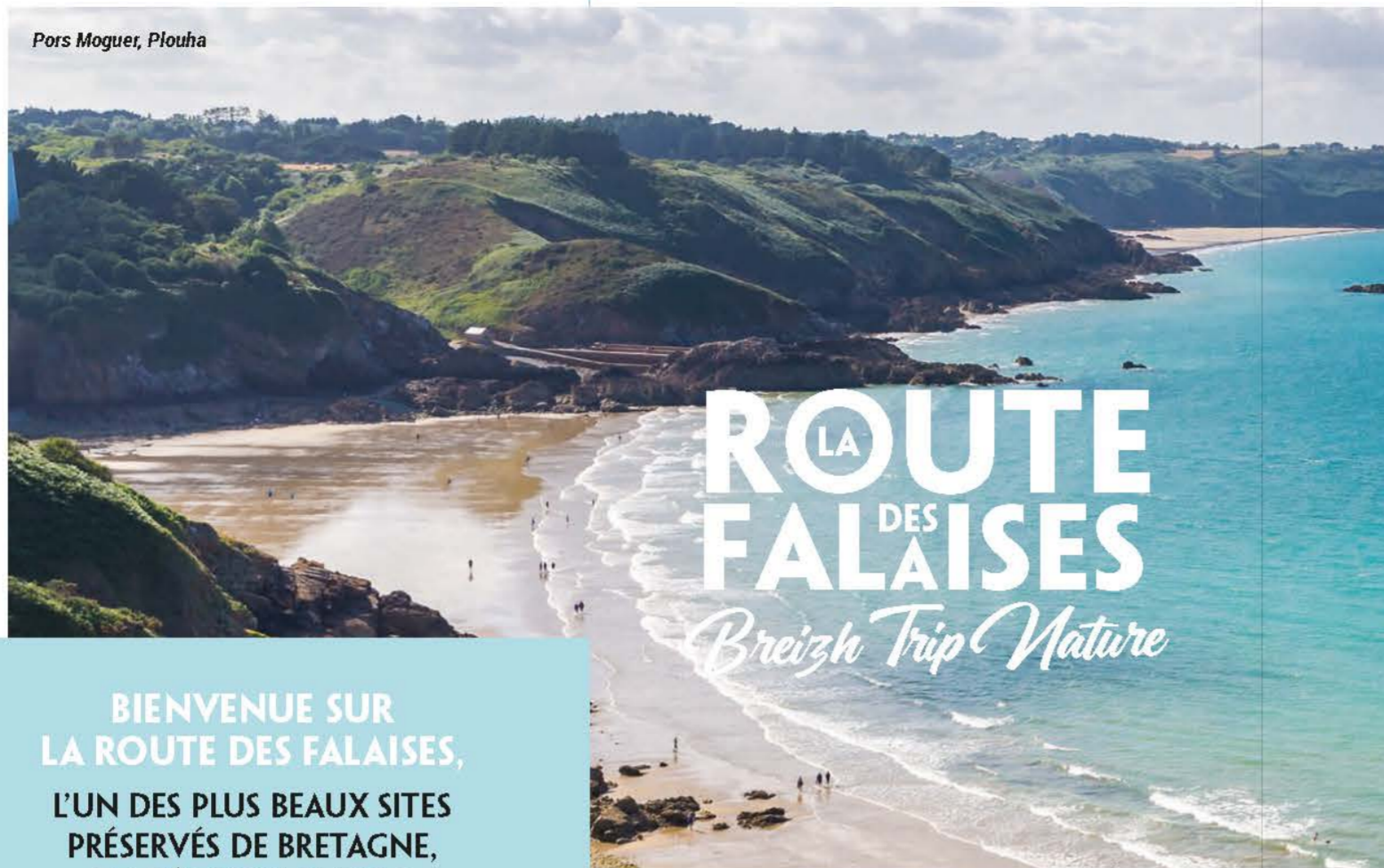
Pors Moguer, Plouha