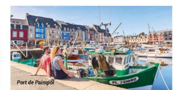
Port de Paimpol