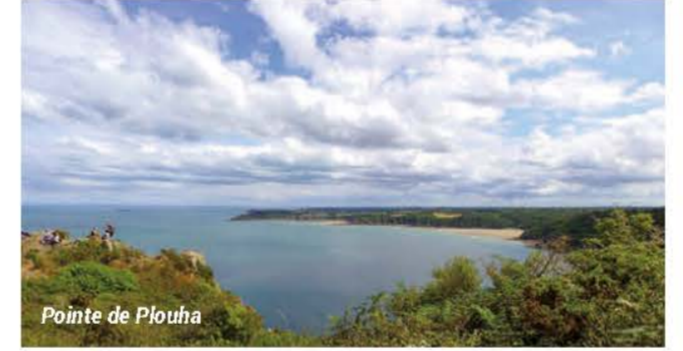
Pointe de Plouha