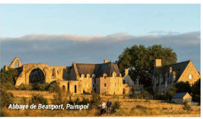
Abbaye de Beauport, Paimpol