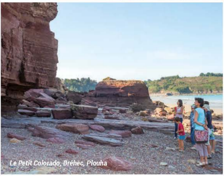
Le Petit Colorado, Bréhec, Plouha