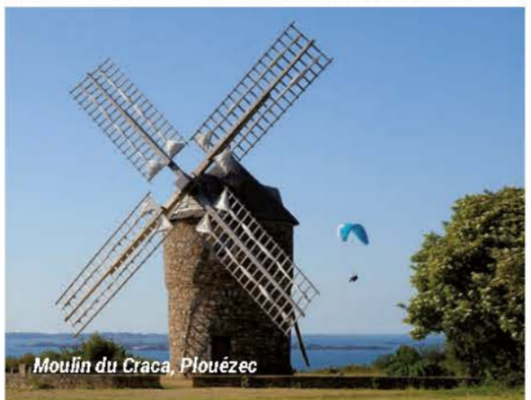
Moulin du Craca, Plouézec