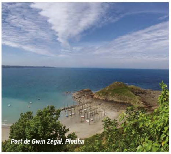
Port de Gwin Zégâl, Plouha