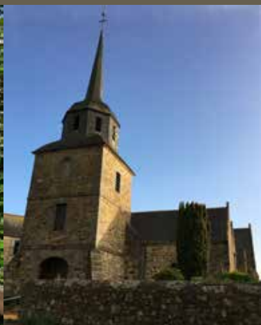
Église de Tréveneuc