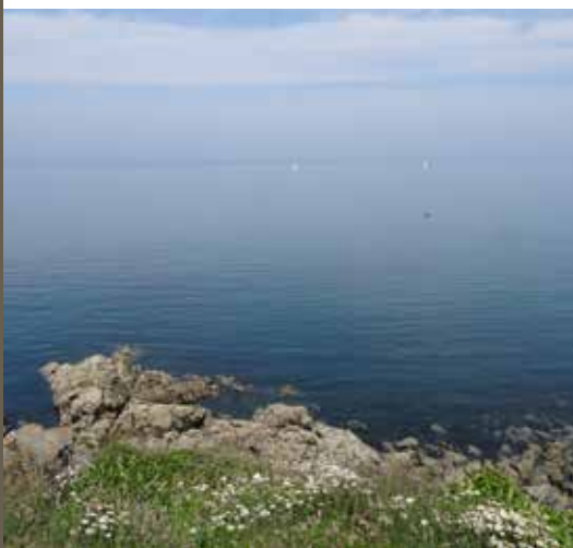
Bec de Vir

« Gored » vient d'un mot breton signifiant pêcherie avec barrage. Le droit de goretterie fut accordé aux seigneurs du Goëlo par les moines de l'abbaye de Beauport à port Goret (mode de capture du poisson coïncé à marée descendante). Les vestiges du barrage sont encore visibles.