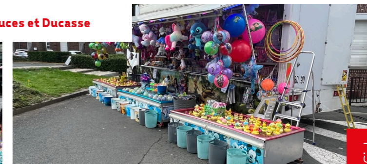
Marché aux puces et Ducasse