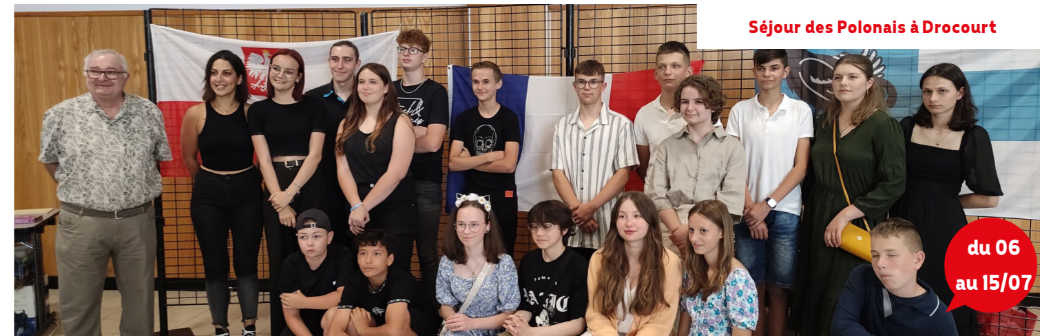
Séjour des Polonais à Drocourt