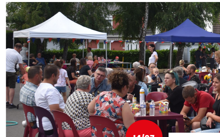
Réception des enseignants