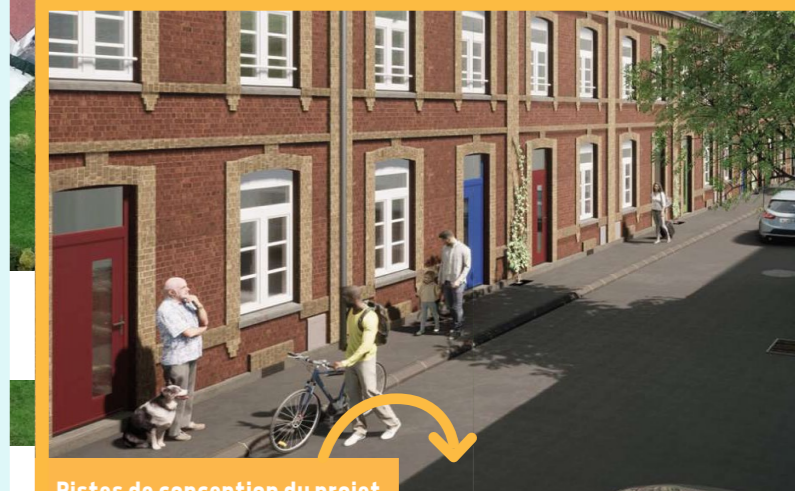
Pistes de conception du projet