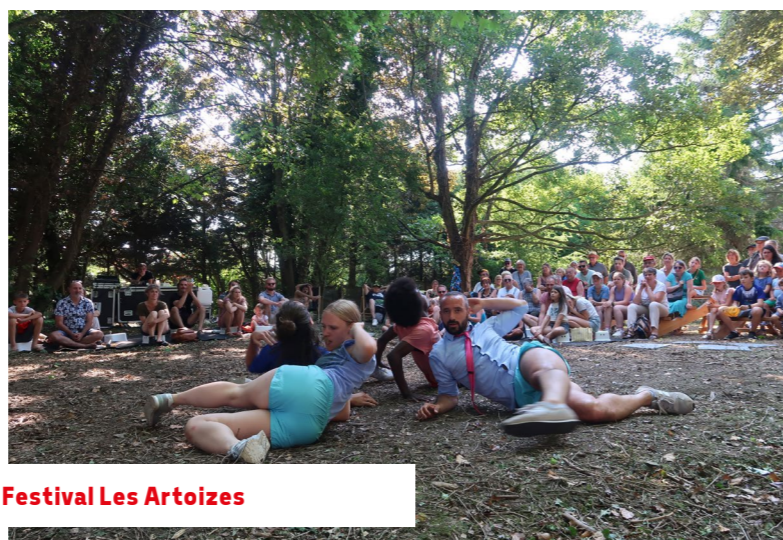
Festival Les Artoizes