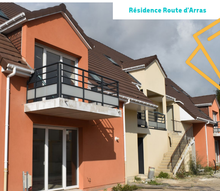
Résidence Route d'Arras