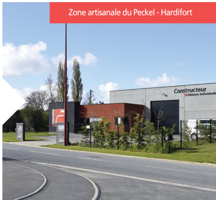
Zone artisanale du Peckel - Hardifort

La finalité est d'avoir un accès via les déplacements doux, notamment piéton, aux centres des villages pour favoriser le développement du commerce de proximité. Aujourd'hui, nous revoions notre politique en matière d'aménagement de zones économiques en vue de passer de 250 à 100 nouveaux hectares aménagés. Permettant ainsi de rendre 150 hectares au monde agricole. Cela passe, comme ici, par des zones artisanales de taille moindre.