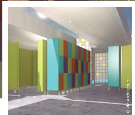
Les vestiaires et casiers