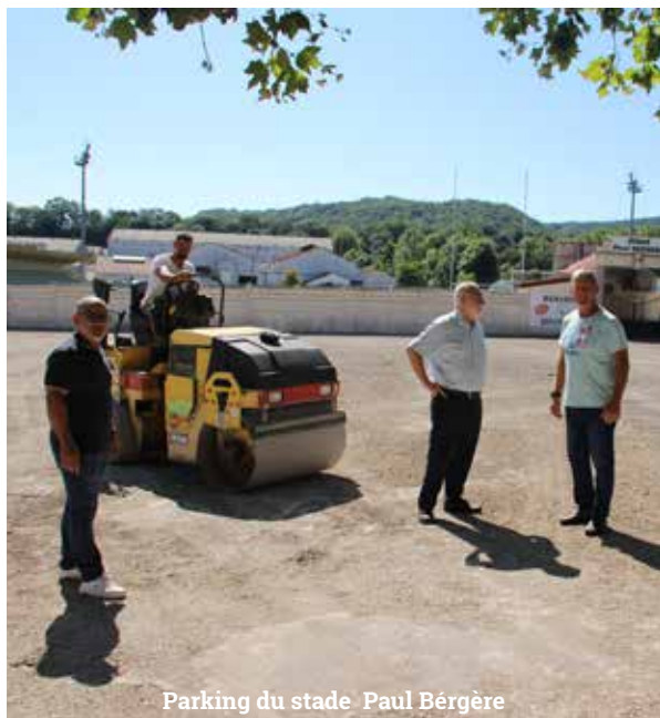
Parking du stade Paul Bérghère