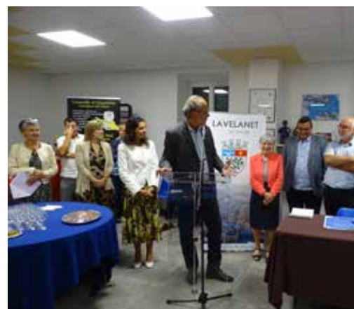
10 ans de Jumelage - Melgaço et Lavelanet