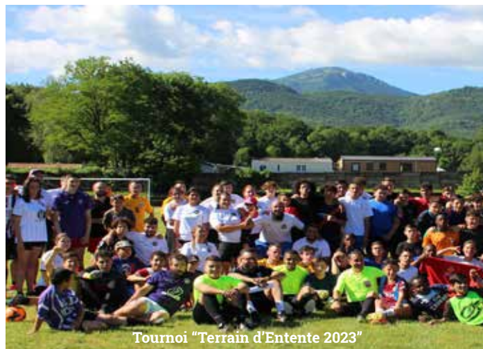
Tournoi "Terrain d'Entente 2023"

Déléguée aux affaires extra scolaire et à l'enfance-jeunesse