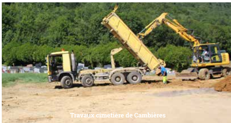
Travaux cimetière de Cambières

Installation de nouvelles toilettes au boulodrome du Club Bouliste