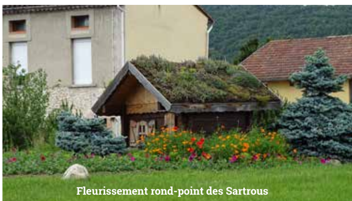
Fleurissement rond-point des Sartrous