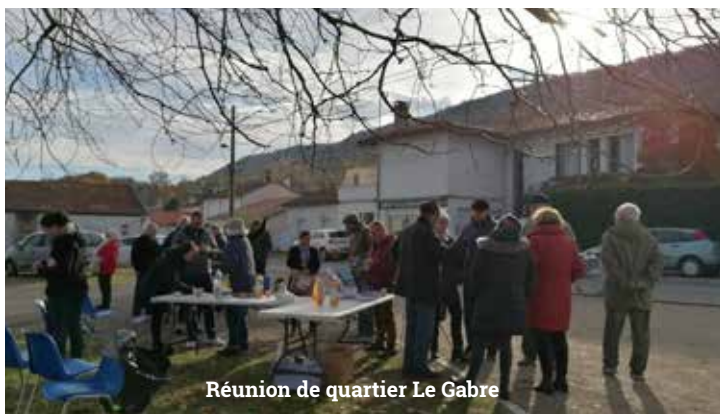
Réunion de quartier Le Gabre

Lancement d'un concours maisons fleuries pour le printemps 2024.