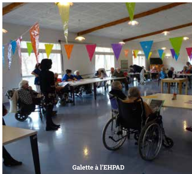
Galette à l'EHPAD

Le Centre Communal d'Action Sociale de Lavelanet œuvre au quotidien et propose un ensemble de prestations pour remédier aux situations de précarité ou de grande difficulté sociale . Le public Lavelanésien y est conseillé, orienté ou directement pris en charge pour bénéficier des services.