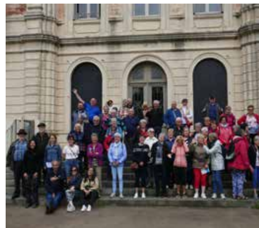
10 ans de Jumelage - Tréguex et Lavelanet