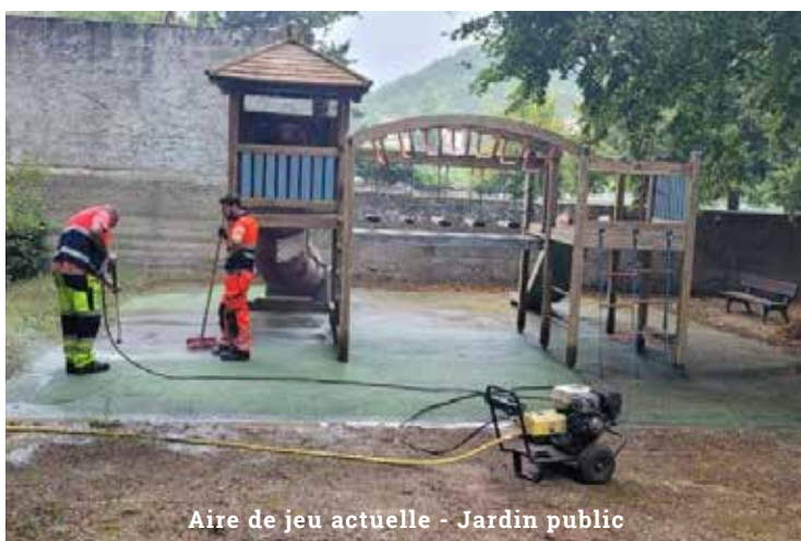
Aire de jeu actuelle - Jardin public

En effet, malgré de nombreux appels au civisme, certaines personnes persistent à déposer leurs sacs-poubelle et encombrants sur la voie publique. Malgré les passages du SMECTOM, des tonnes de ces sacs, et autres détritiques sont ramassés, toutes les semaines, par les agents des services techniques. Un coût : 160.000€ par an , et un constat, la mairie doit parer au plus dommageable.