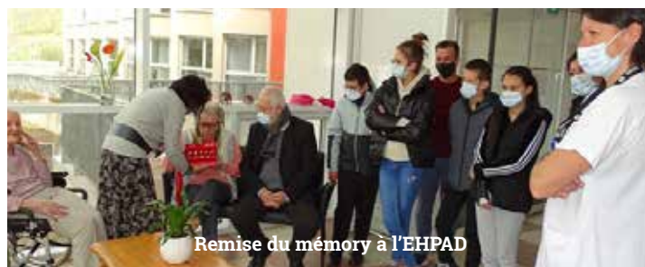
Remise du memory à l'EHPAD

En 2019, la municipalité s'est engagée dans une nouvelle gestion du service enfance jeunesse et a signé une convention avec LEC Grand Sud (Loisirs éducation et citoyenneté). Cette année encore, et de façon complémentaire à la politique que nous menons en faveur notamment des travaux de rénovation et d'entretien des écoles , la Mairie accompagne les enfants sur le chemin de la réussite. Notre mission est de les aider, ainsi que leurs familles, dans leur parcours au quotidien. Propriétaire des écoles publiques, la mairie veille bien entendu à ce que les enfants et les équipes éducatives soient accueillis dans les meilleures conditions , mais elle agit bien au-delà. Avec ses agents d'entretien, de restauration, son soutien aux projets, son travail avec les équipes pédagogiques, elle est un membre à part entière de la communauté éducative. Par ailleurs, nous nous investissons par le biais des centres de loisirs, des ALAE ou de l'Espace jeunes pour permettre aux enfants et aux jeunes d' acquérir une autonomie dans une démarche citoyenne avec le respect des valeurs de la République et de Laïcité. Nous intervenons aussi à l'école Jeanne d'Arc, la Mairie est soucieuse de tous les enfants, qu'ils soient dans une école publique ou privée.