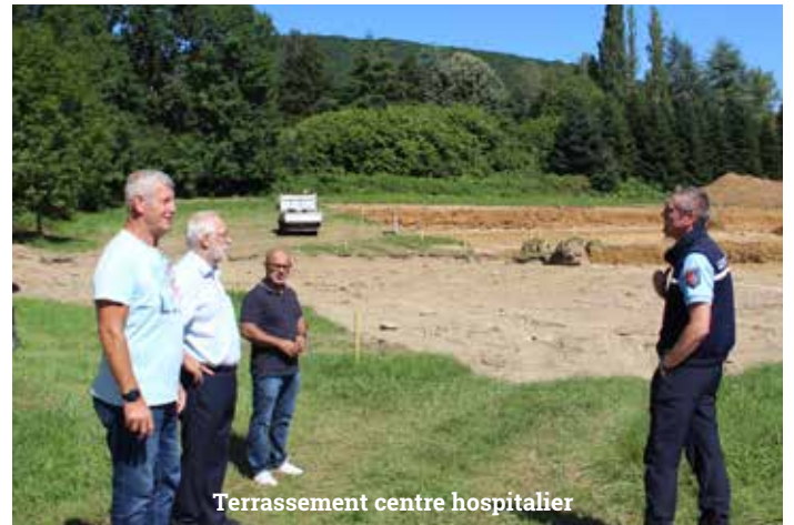
Terrassement centre hospitalier