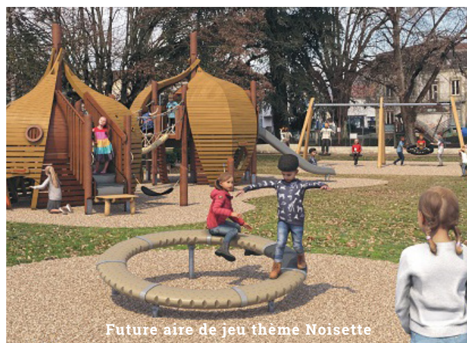
Future aire de jeu thème Noisette

Nuisibles. La municipalité entreprend avec l'appui d'entreprises spécialisées, chaque année et ce, à plusieurs reprises, divers traitements contre ces nuisibles, rats, pigeons, etc. La prolifération de ces derniers est accentuée par l'indiscipline de certains ; notamment, pour les pigeons que des habitants nourrissent, permettant ainsi leur multiplication. Il en est de même pour les chats errants. Un fléau qui coûte cher à la collectivité pour leur stérilisation. Concernant les déjections des chiens, des sacs sont à votre disposition en mairie . Nous avons dû cesser de les fournir en divers endroits libres de la ville, pour cause de dégradations dans les alcôves qui les abritaient.