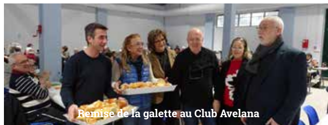
Remise de la galette au Club Avelana

Goûter Épiphanie aux clubs des aînés et à l'EPAHD, anniversaires des centenaires.