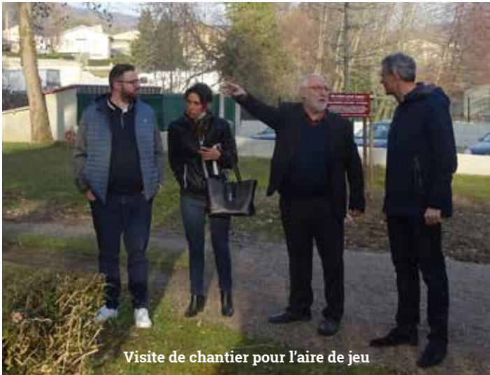
Visite de chantier pour l'aire de jeu

La priorité sera donnée jusqu'à la fin du mandat à la rénovation de nos bâtiments publics (toitures, mises aux normes, etc.). L'entretien de vos quartiers, de vos rues, de nos équipements publics et sportifs sont au cœur de nos préoccupations et demandent un réel investissement.