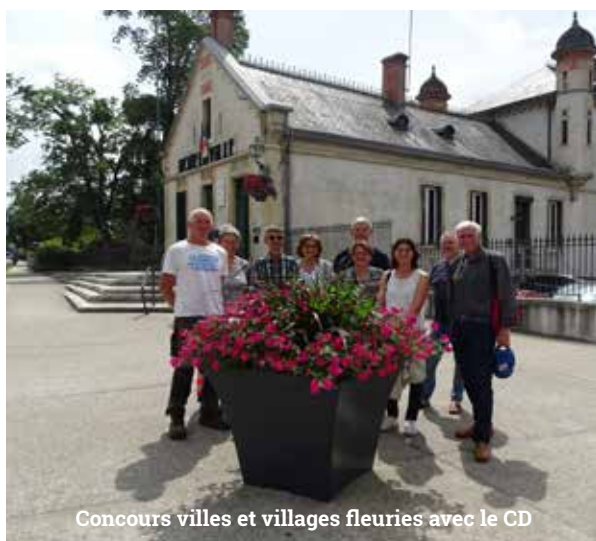
Concours villes et villages fleuries avec le CD

Participation citoyenne et Maison des projets, communication, embellissement du bourg-centre (fleurrissement, illuminations). Autant de mots qui résonnent en moi et m'obligent envers vous.