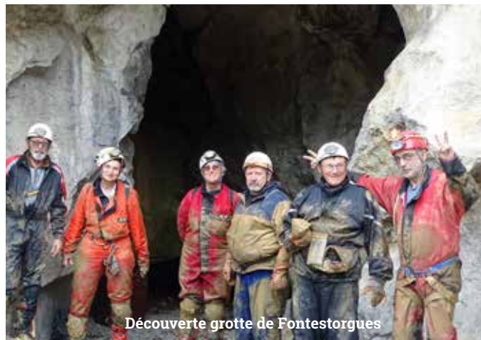
Découverte grotte de Fontestorques

Le maillage associatif local nous permet de compléter l'offre culturelle et de conforter le projet de la ville. Les associations culturelles sont nombreuses et proposent des animations et des activités de grande qualité. La force de ces associations c'est aussi de savoir travailler entre elles , un des exemples le plus récents c'est le magnifique concert donné lors de la Sainte Cécile au Marché Couvert par la Société Philharmonique et le Coq Lavelanétien.