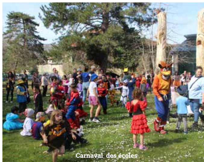
Carnaval des écoles

Chantiers Ville Vivez Bougez : Fabrication par les jeunes de 2 tables forestières et rénovation du kiosque au jardin de la Marne