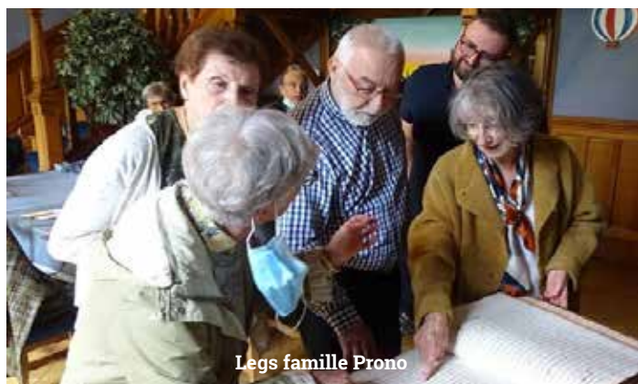
Legs famille Prono