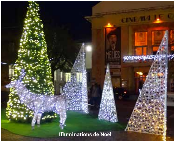
Illuminations de Noël

Mise en place d'une mutuelle santé communale