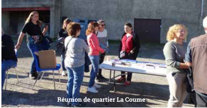
Réunion de quartier La Coume