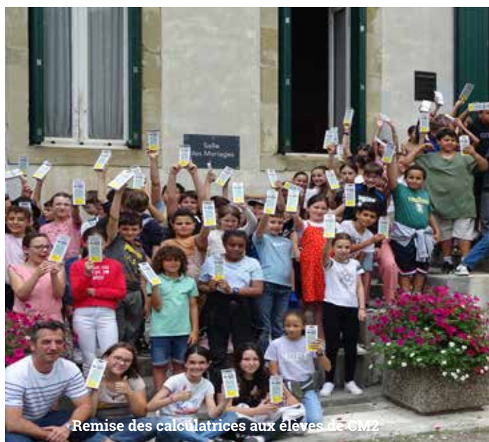
Remise des calculatrices aux élèves de CM2

Éducateur de formation, je suis actuellement Conseiller à la Mission Locale de l'Ariège où j'accompagne les jeunes dans leur insertion sociale et professionnelle. Nous avons avec le groupe de travail, le souci de proposer aux Lavelanédiens des services de qualités afin que leurs enfants soient accueillis dans les meilleures conditions. Laïcité, citoyenneté, parentalité et éducation populaire sont des valeurs que je défends et qui me guident dans la gestion de ce service.