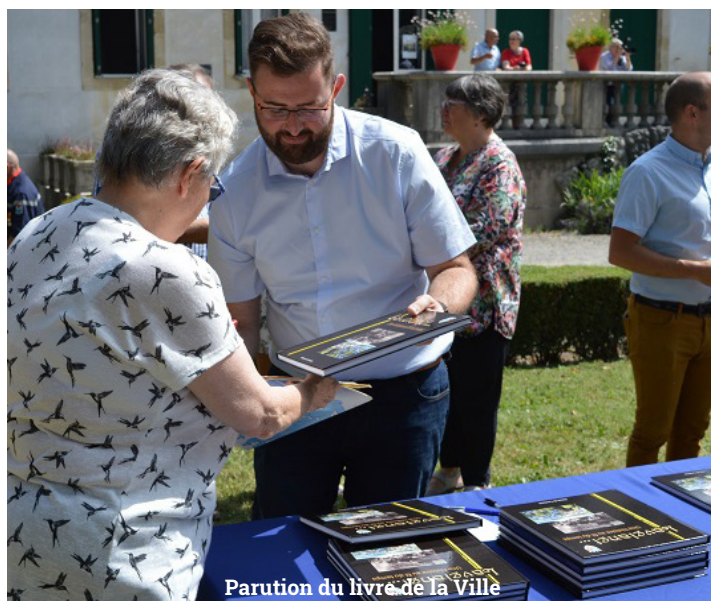
Parution du livre de la Ville