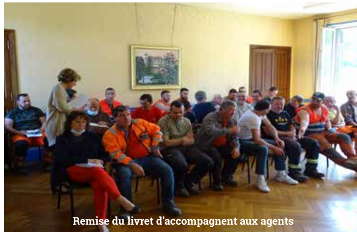
Remise du livret d'accompagnement aux agents

Depuis le début du mandat en mars 2020, le Service des Ressources Humaines a réalisé une grande partie de ses missions suite au rapport de la Chambre Régionale des Comptes . Afin de renforcer la qualité du Service Public, la Loi de la Transformation de la Fonction Publique du 6 août 2019 a été mise en œuvre ce qui nous donne de nouveaux leviers pour réussir dans l'exercice de nos missions.