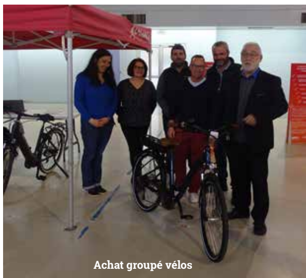
Achat groupé vélos

Lieu ressource depuis 2016, la « Maison des Projets » est ouverte à tout public et répond à toutes les questions sur la rénovation du centre-ville et son cadre de vie (les démolitions, la réhabilitation, les constructions...); elle centralise toutes les informations sur le projet de rénovation urbaine: plans, maquettes, etc. La Maison des projets est aussi, et avant tout peut-être, un lieu de rencontres et de débats . Elle a pour vocation de soutenir, valoriser et favoriser les initiatives citoyennes, c'est-à-dire d'aider au mieux les habitants qui sont motivés pour agir pour leur ville, renforcer le lien social et améliorer le cadre de vie .