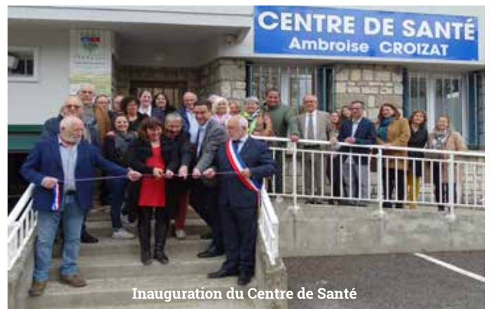
Inauguration du Centre de Santé

La mairie de Lavelanet a consenti un gros effort financier pour ce faire , et l'équilibre est là, bien qu'encore fragile. D'autant que Lavelanet a investi dernièrement 150.000€ de travaux dans les locaux de l'ancienne trésorerie qui accueille aujourd'hui le centre de santé dans des locaux plus spacieux et en adéquation avec une demande grandissante.