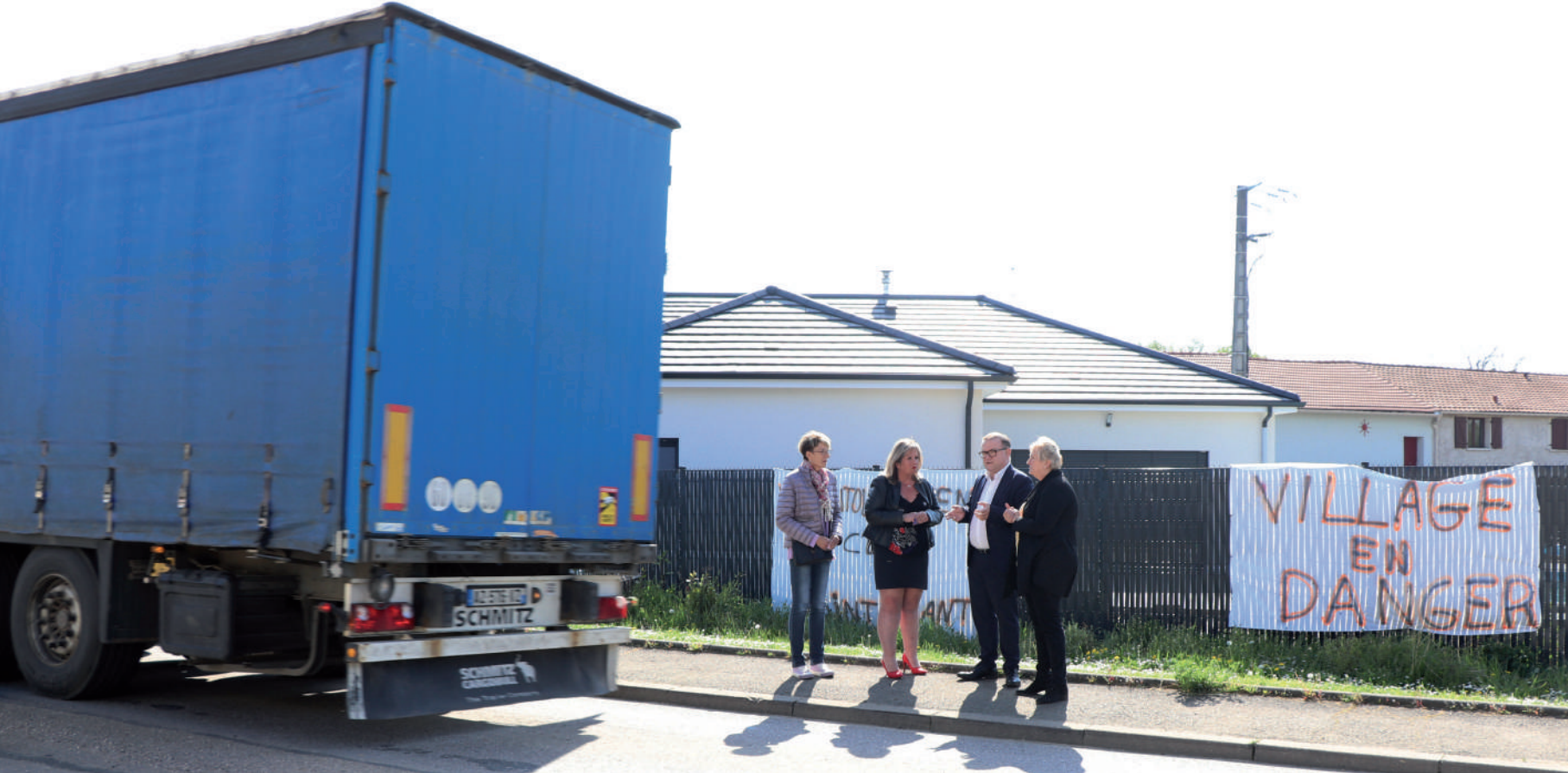
Le Maire, Conseiller Départemental en visite à Ville en Vermois.